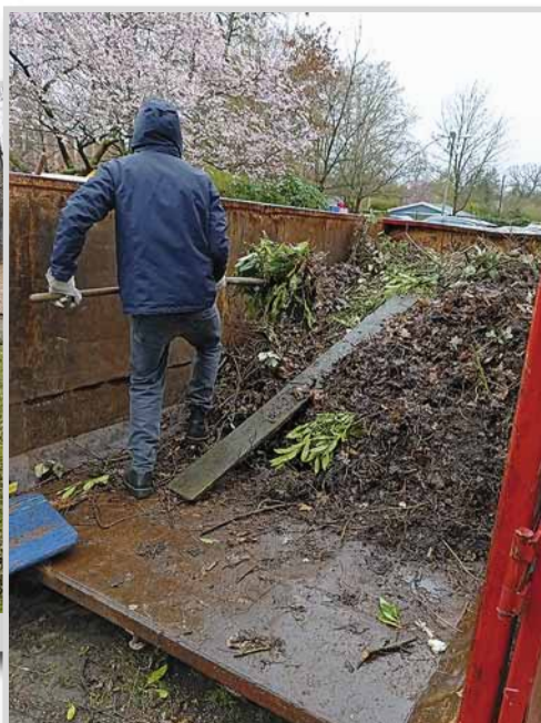
Das Laub muss weg