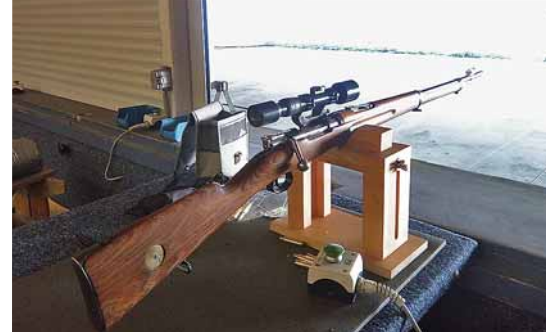
Ein Carl Gustav M96 Schweden-Mauser, Baujahr 1916, mit Zielfernrohr, Disziplin Zielfernrohrgewehr 1

Im April und Mai fanden auf dem Schießstand der Schützengemeinschaft Norderstedt die jährlichen Landesmeisterschaften des Bunds der Militär- und Polizeischützen (BDMP) für Lang- und statische Kurzwaffe statt.