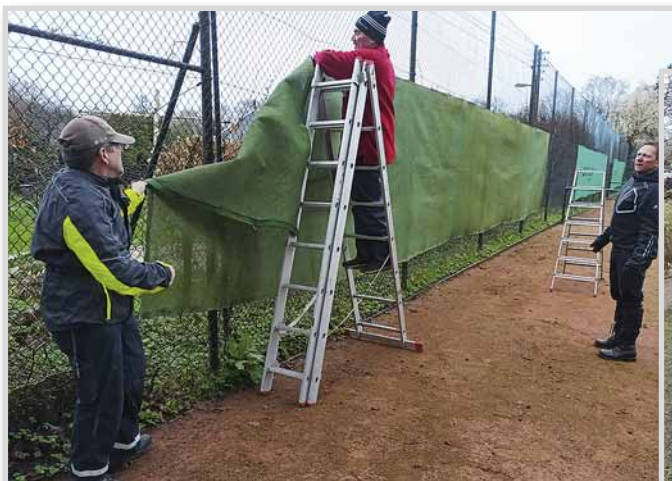
Lieber nicht zu hoch