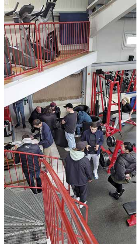
Wo kann ich unterschreiben?