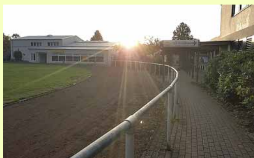
Das Außenbüro hinten links in der Fitnesshalle

Seit April ist das Außenbüro auf der LSV-Anlage Borsteler Chaussee (neben dem Eingang zum Fitness-Gym) immer mittwochs von 15:00 bis 17:00 Uhr geöffnet. Dort steht ein:e Mitarbeiter:in der Geschäftsstelle für Fragen und sonstige Anliegen gerne zur Verfügung.