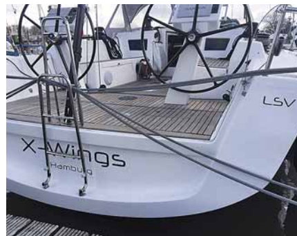
Hamburger Yachthafen/Wedel an der Elbe 2022, X-Wings und Albatros (Archivbilder)