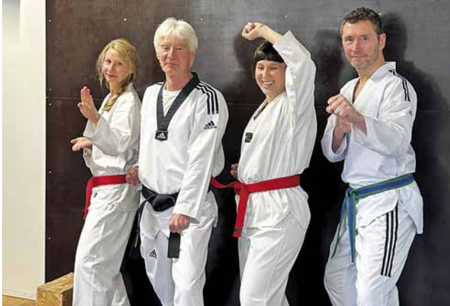
Der Auftritt der Sparte Taekwondo kam blendend an

Schlag auf Schlag ging es am 6. Mai im LSV Fitness Gym! Rund 70 Interessierte kamen zum „Tag der offenen Tür“, um sich Räume und Geräte anzuschauen und um unsere Trainer:innen kennenzulernen. Und viele entschieden sich noch vor Ort für eine Mitgliedschaft.