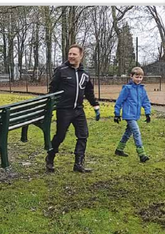
Bankplatzsuche für Zaungäste