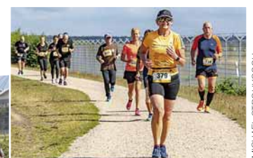
Lauf 2022 bei Kilometer 13 in Niendorf