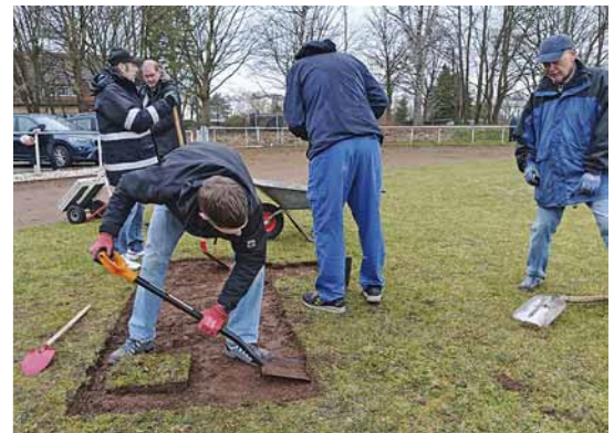
Vorbereitung am Arbeitstag