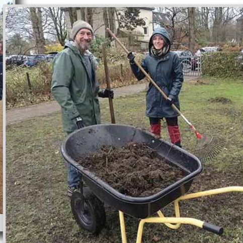
Karre voll und ab damit