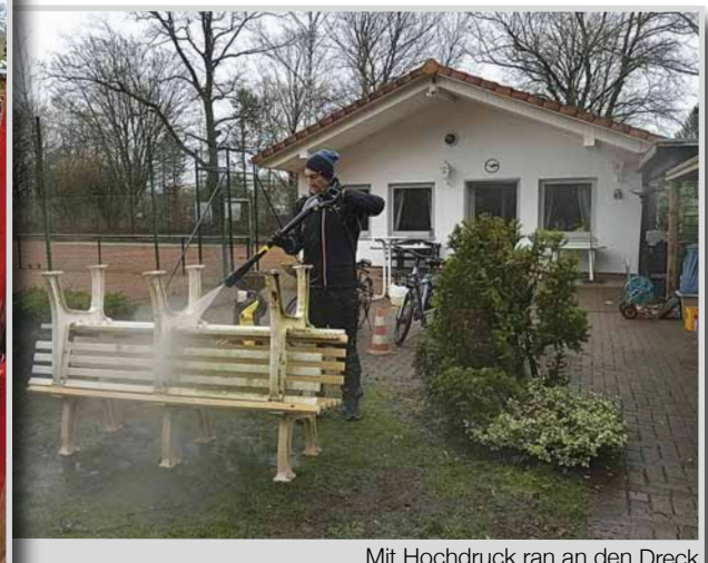
Mit Hochdruck ran an den Dreck