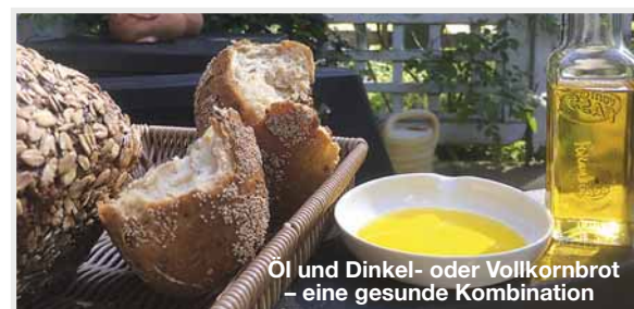
Öl und Dinkel- oder Vollkornbrot – eine gesunde Kombination