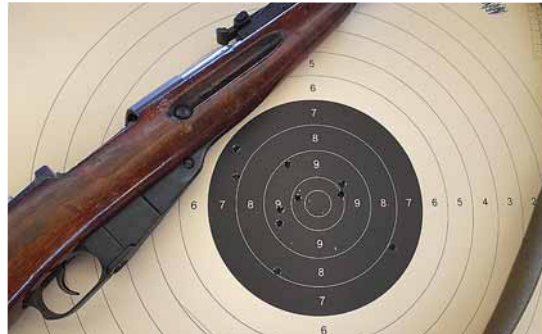
Repetiergewehr Mosin-Nagant Model 189130 mit beschossener Wertungsscheibe Dienstgewehr 1

modifiziert sowie Zielfernrohrge- wehr 1 jeweils den ersten Platz sowie in der Mannschaftswertung ebenfalls die vorderen Plätze.